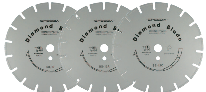
S II-12 アスファルト コンクリート兼用