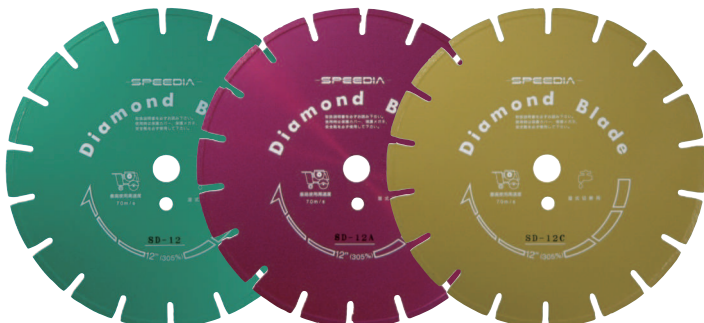
SD-12 アスファルト コンクリート兼用